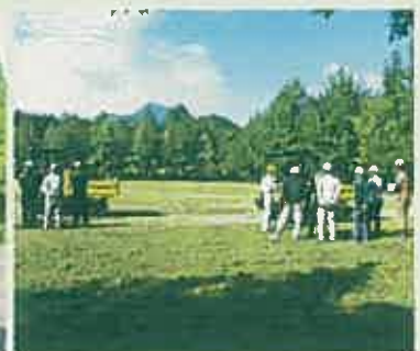
不整地運搬車運転技能講習