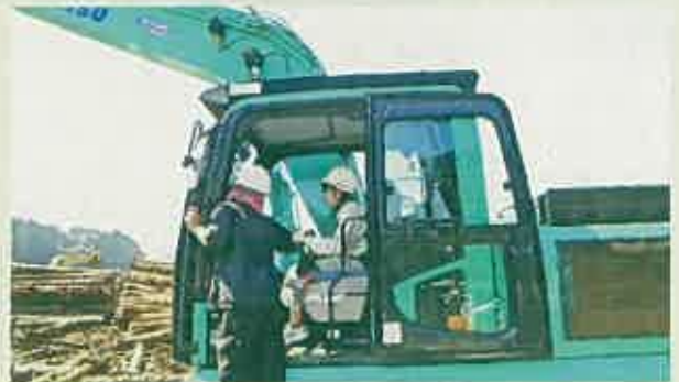
高性能林業機械実習