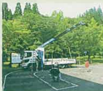
小型移動式クレーン運転技能講習