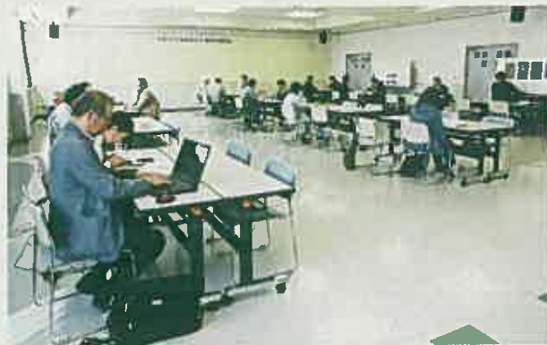
個別相談（宮崎・3月）