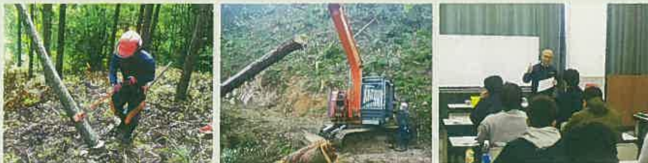
研修状況（左から、かかり木処理作業、集材作業、講義）