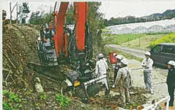
現場視察（宮崎・3月）