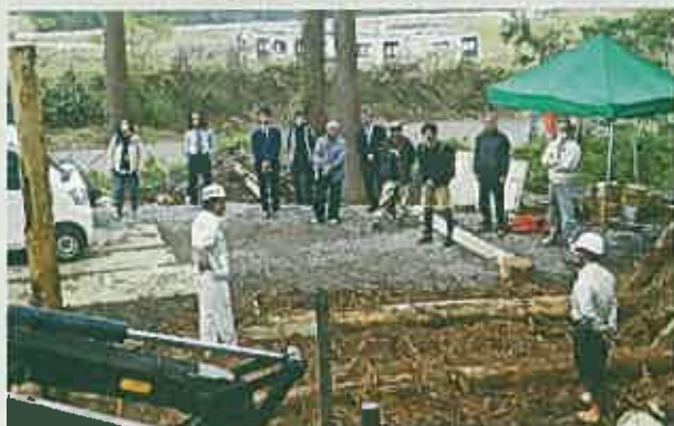
現場視察（宮崎・11月）