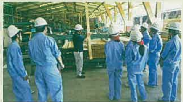
木材加工施設見学