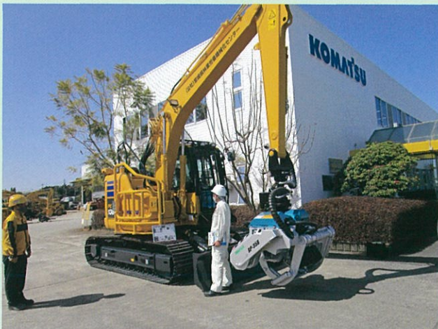
令和3年度導入のプロセッサ (コマツPC138US-11 イワフジGP35B)

そのため、当センターのホームページに随時空き状況を掲載したり、各事業者に対して利用促進を図る手段を講じていきたいと考えています。