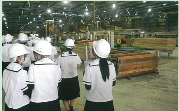
木材加工施設見学