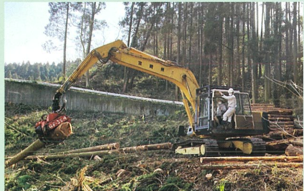
プロセッサの体験