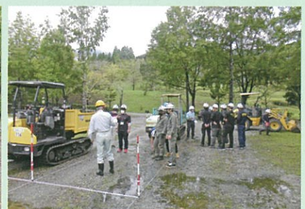
不整地運搬車運転技能講習