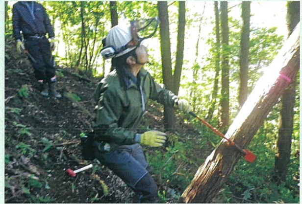
かかり木処理研修