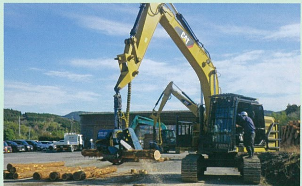
高性能林業機械実習