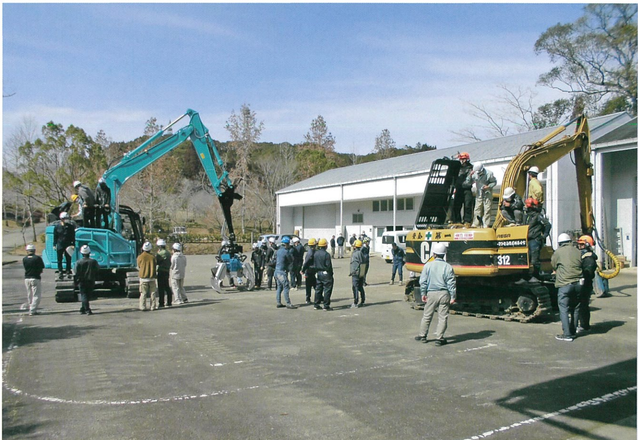
高性能林業機械メンテナンス研修