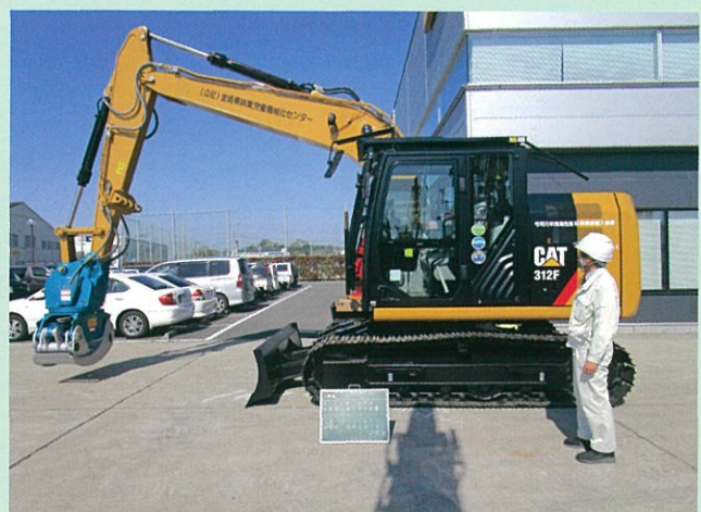
令和元年度導入のスイングヤーダ (CAT312F イワフジCS-90LJV)