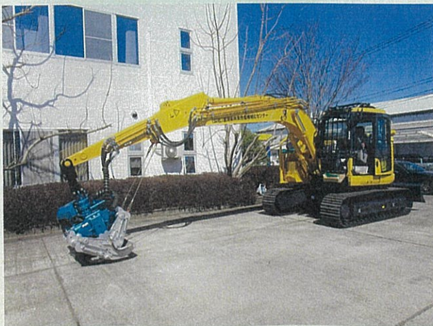
令和4年度導入のプロセッサ (コマツPC138US-11 イワフジGP35V2)