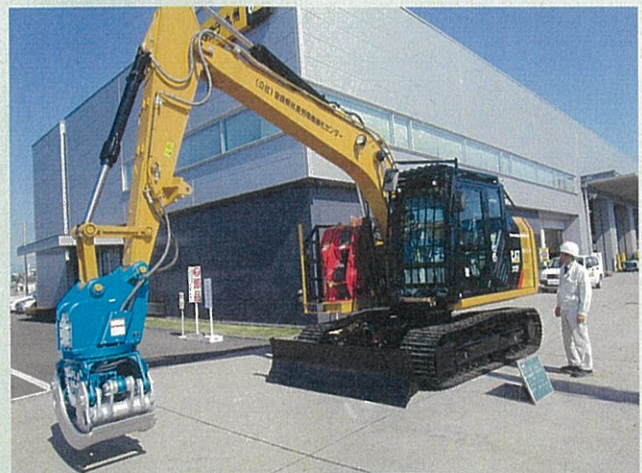
令和元年度導入のスイングヤーダ (CAT312F イワフジCS-90LJV)