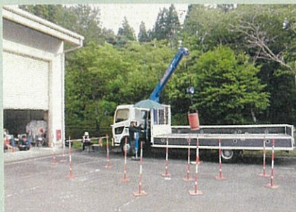
小型移動式クレーン

令和4年度の研修生は17名で、5月30日から11月15日までの実質44日間の研修を無事終了しました。