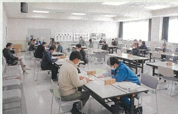
林業事業者との個別相談