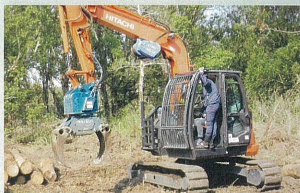
林業機械の操作体験