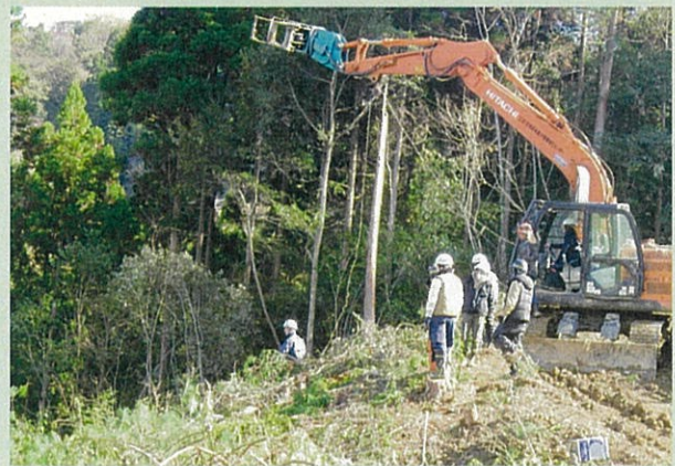
高性能林業機械研修