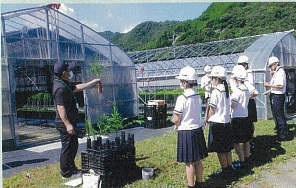
杉コンテナ苗生産施設見学

参加した高校生は、講義・実習に熱心に取り組み、森林・林業に関心を示していました。