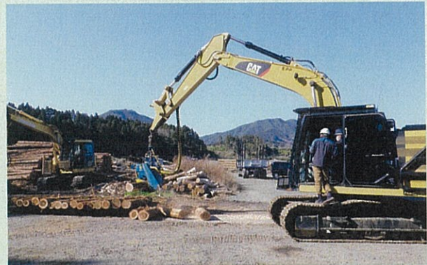
高性能林業機械体験学習