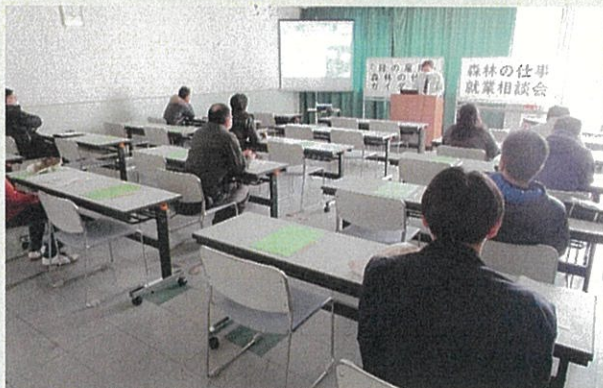
森林の役割・林業の仕事の説明

このあと、参加者は林業事業者の作業現場に移動し、現場の説明を受けるとともに、林業機械(グラップル)の操作を体験することもできました。