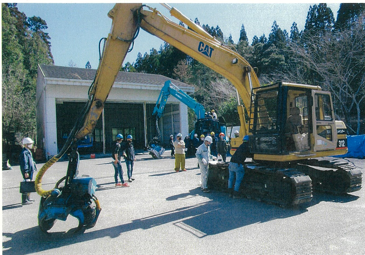
高性能林業機械メンテナンス研修