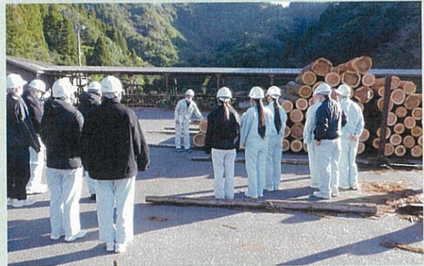
林産物流通センター見学