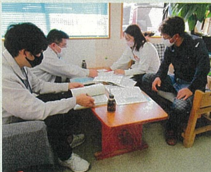
認定林業事業体指導

「緑の雇用」に取り組む認定林業事業体を対象に、各事業体が行う実践研修（OJT研修）の指導及び監督検査を行っています。