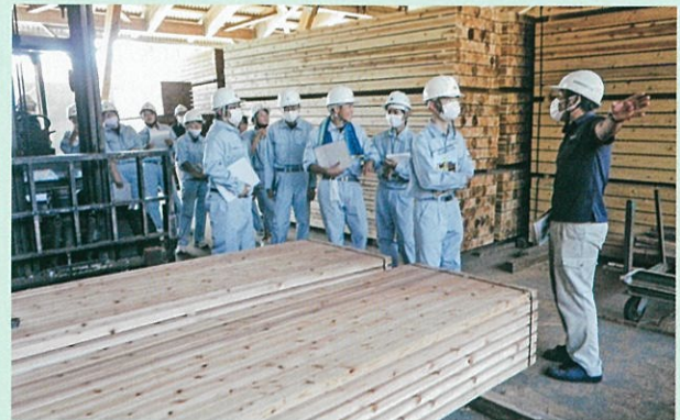
木材加工施設見学