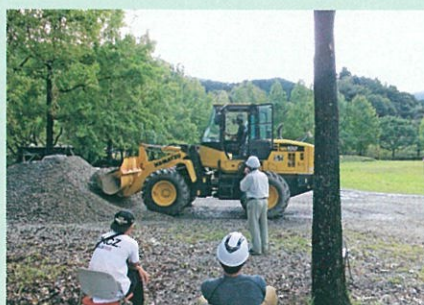
車両系建設機械運転技能講習