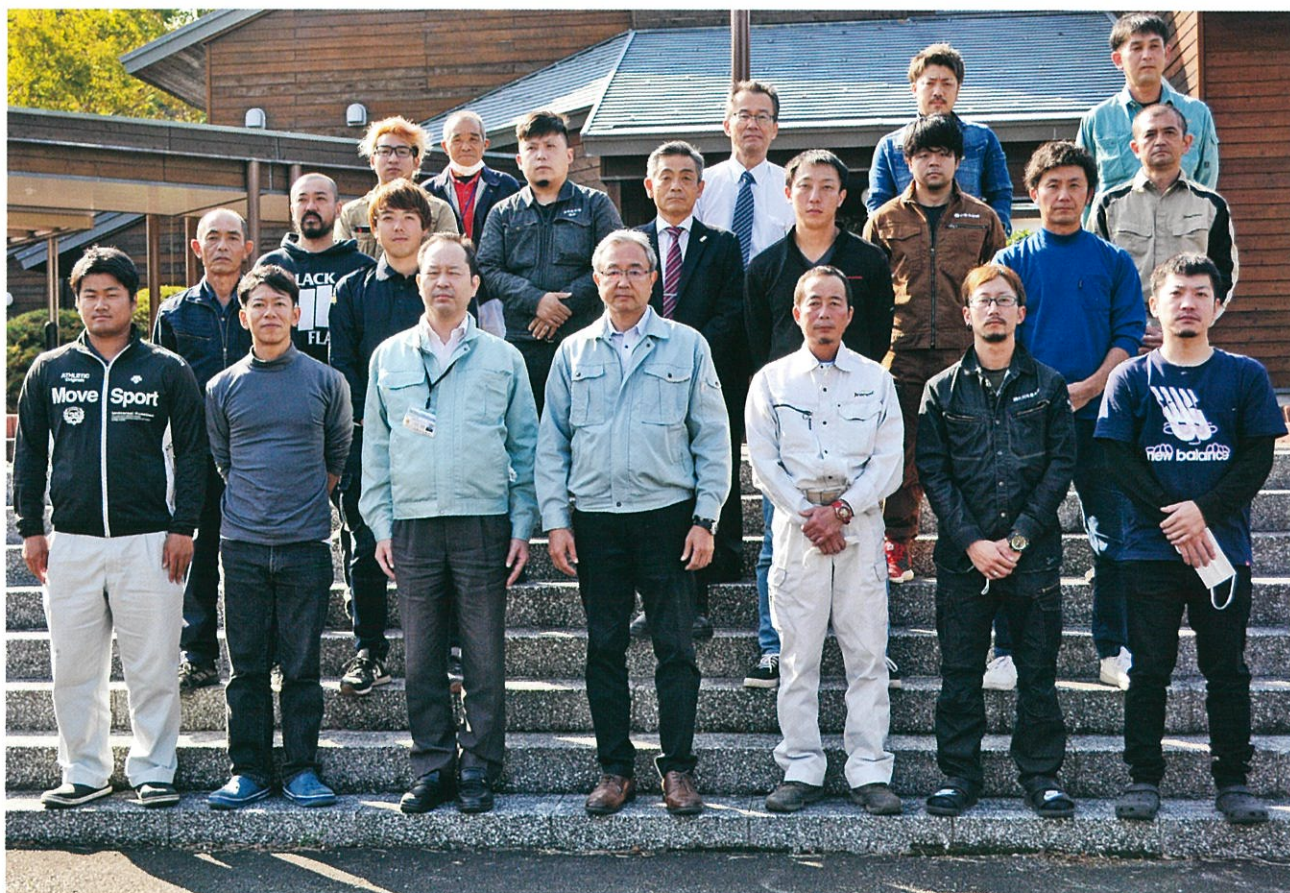
林業作業士養成研修修了者