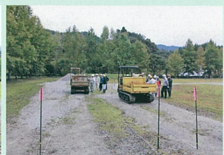
不整地運搬車運転技能講習