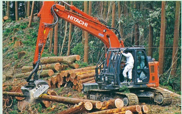
プロセッサの体験