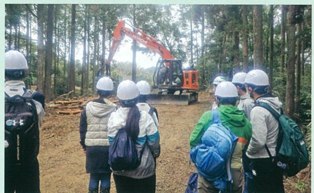
高性能林業機械実習