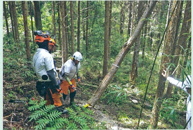
かかり木処理研修