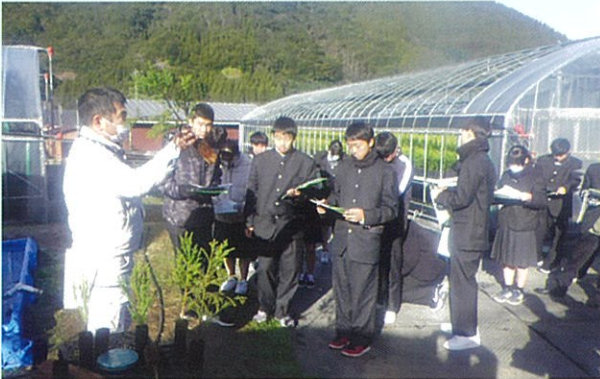
杉コンテナ苗生産施設見学

参加した高校生は、講義・実習に熱心に取り組み、森林・林業に関心を示していました。