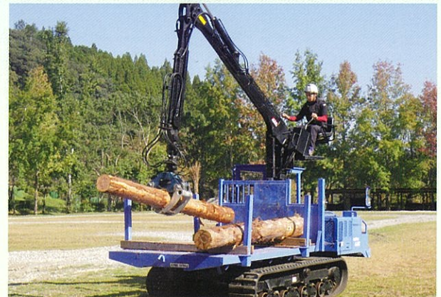
走行集材機械特別教育