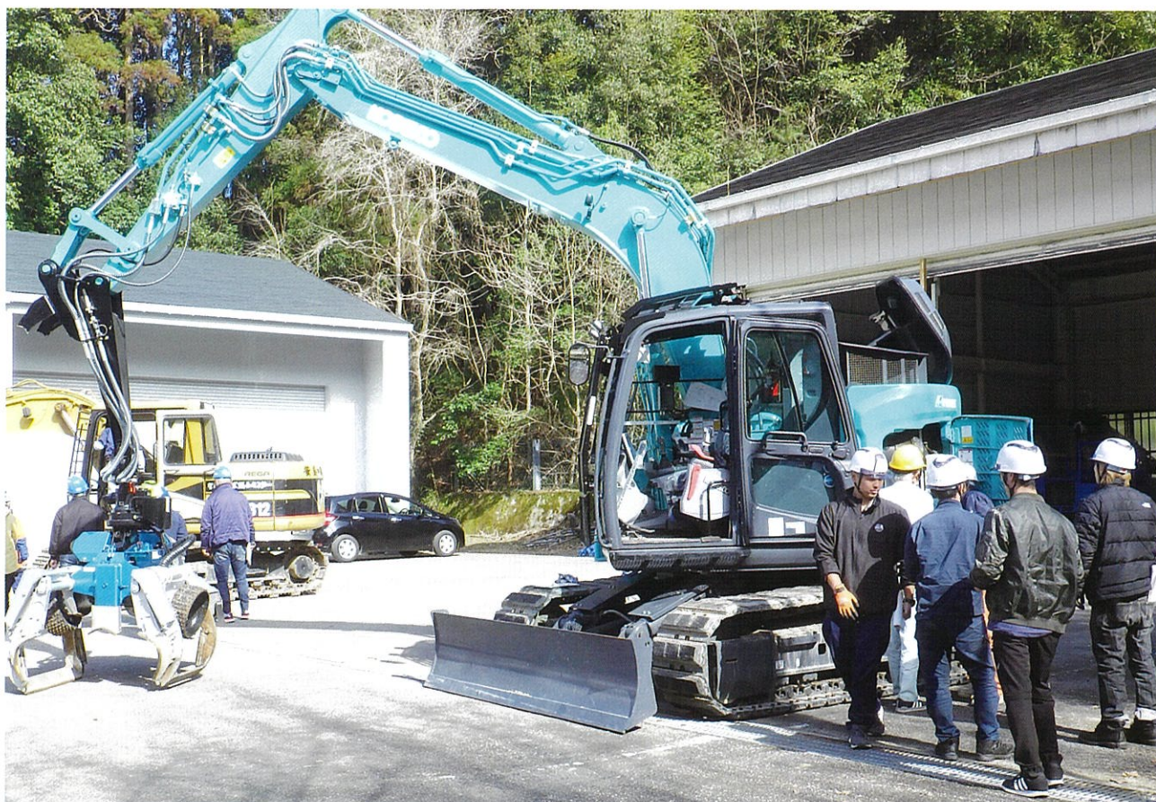
高性能林業機械メンテナンス研修