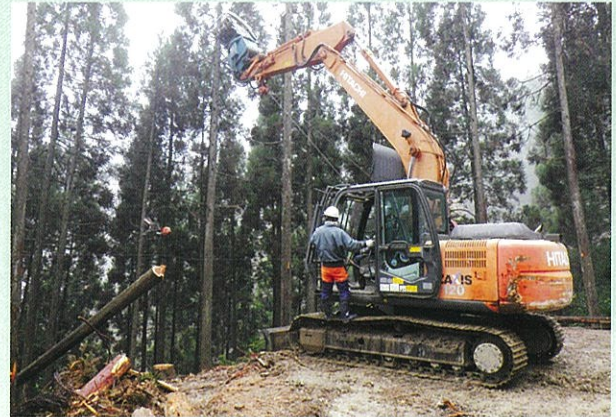
高性能林業機械研修