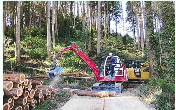
高性能林業機械の操作体験