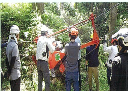
林業架線作業主任者免許講習

令和5年度の研修生は6名で、5月29日から11月15日までの実質39日間の研修を無事終了しました。