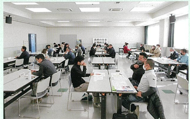
林業事業者との個別相談