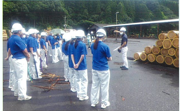
林産物流通センター見学