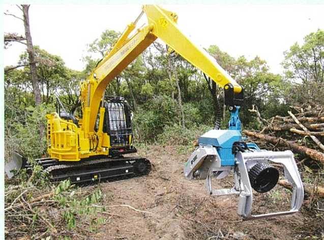
令和5年度導入のプロセッサ (コマツPC138US-11、イワフジGP35V2)