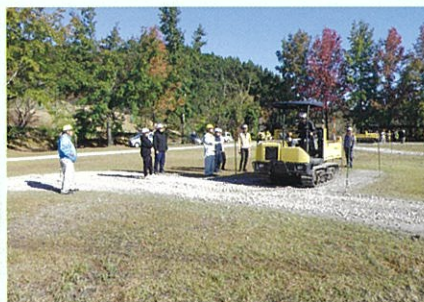
不整地運搬車運転技能講習