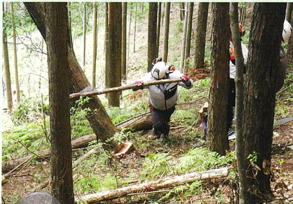
かかり木処理研修