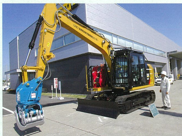
令和元年度導入のスイングヤーダ (コマツCAT312F、イワフジCS-90LJV)