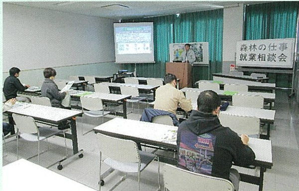
森林の役割・林業の仕事の説明

このあと、参加者は林業事業者の作業現場に移動し、現場の説明を受けるとともに、高性能林業機械（プロセッサ）の操作を体験することもできました。