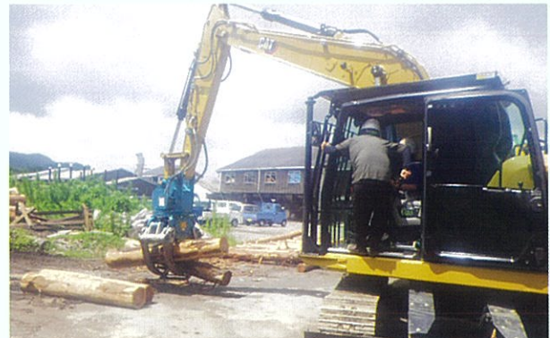
高性能林業機械体験学習